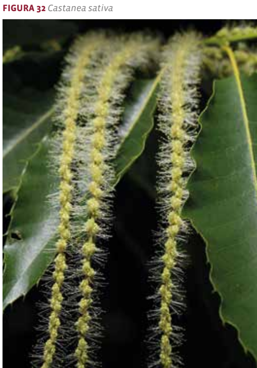
FIGURA 32 Castanea sativa