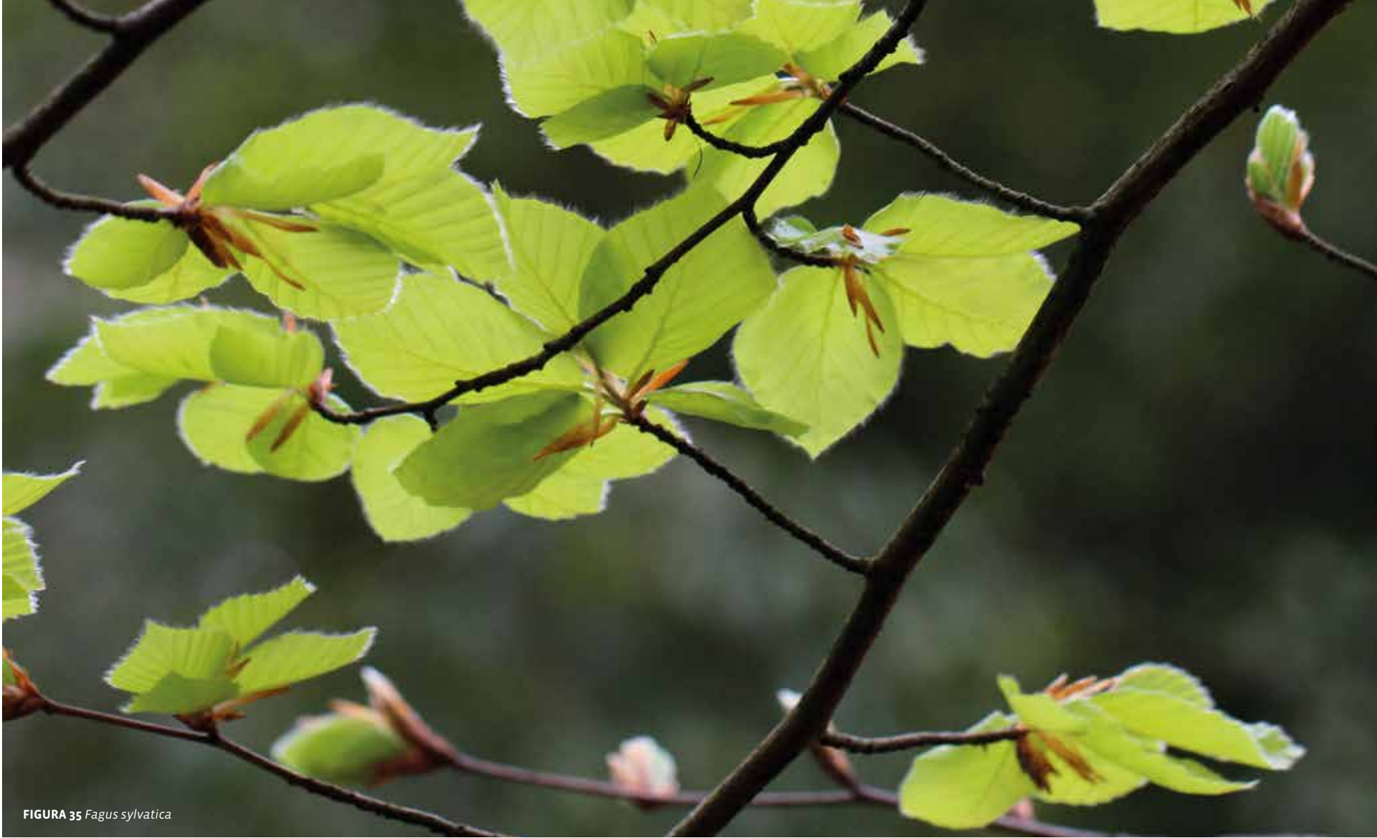
FIGURA 35 Fagus sylvatica