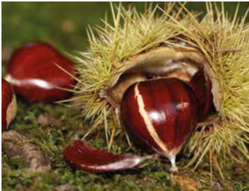
FIGURA 8 Castanea sativa