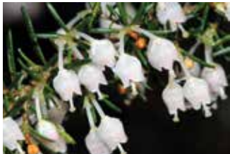
FIGURA 10 Erica arborea