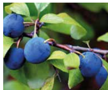
FIGURA 14 Prunus spinosa