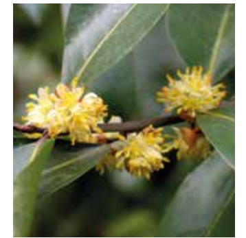
FIGURA 5 Laurus nobilis