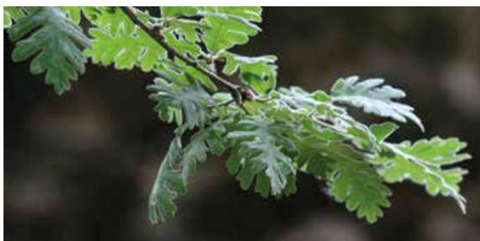
FIGURA 15 Quercus pyrenaica