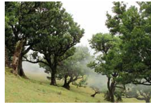
FIGURA 4 Laurissilva