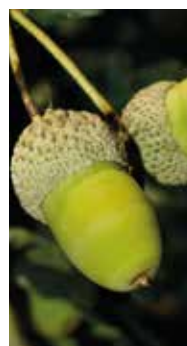
FIGURA 16 Quercus robur

Estas florestas naturais são constituídas por comunidades vegetais que representam etapas climáticas terminais e que caracterizam o habitat. Possuem uma estrutura complexa, multiestratificada, com diversas espécies arbóreas características, como o carvalho-alvarinho ( Quercus robur ), o carvalho-negral ( Quercus pyrenaica ), o castanheiro ( Castanea sativa ), a faia ( Fagus sylvatica ), o bidoeiro ( Betula pubescens ), acompanhadas por espécies sempre-verdes, relíquias da floresta Laurissilva, como o azereiro ( Prunus lusitânica ), o folhado ( Viburnum tinus ), o medronheiro ( Arbutus unedo ). O estrato arbustivo é igualmente caracterizado por algumas espécies emblemáticas, tais como o pilriteiro ( Crataegus monogyna ), a urze-branca ( Erica arborea ), o escalheiro ( Pyrus cordata ). A den-