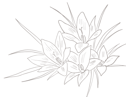
FIGURA 29 Physospermum cornubiense