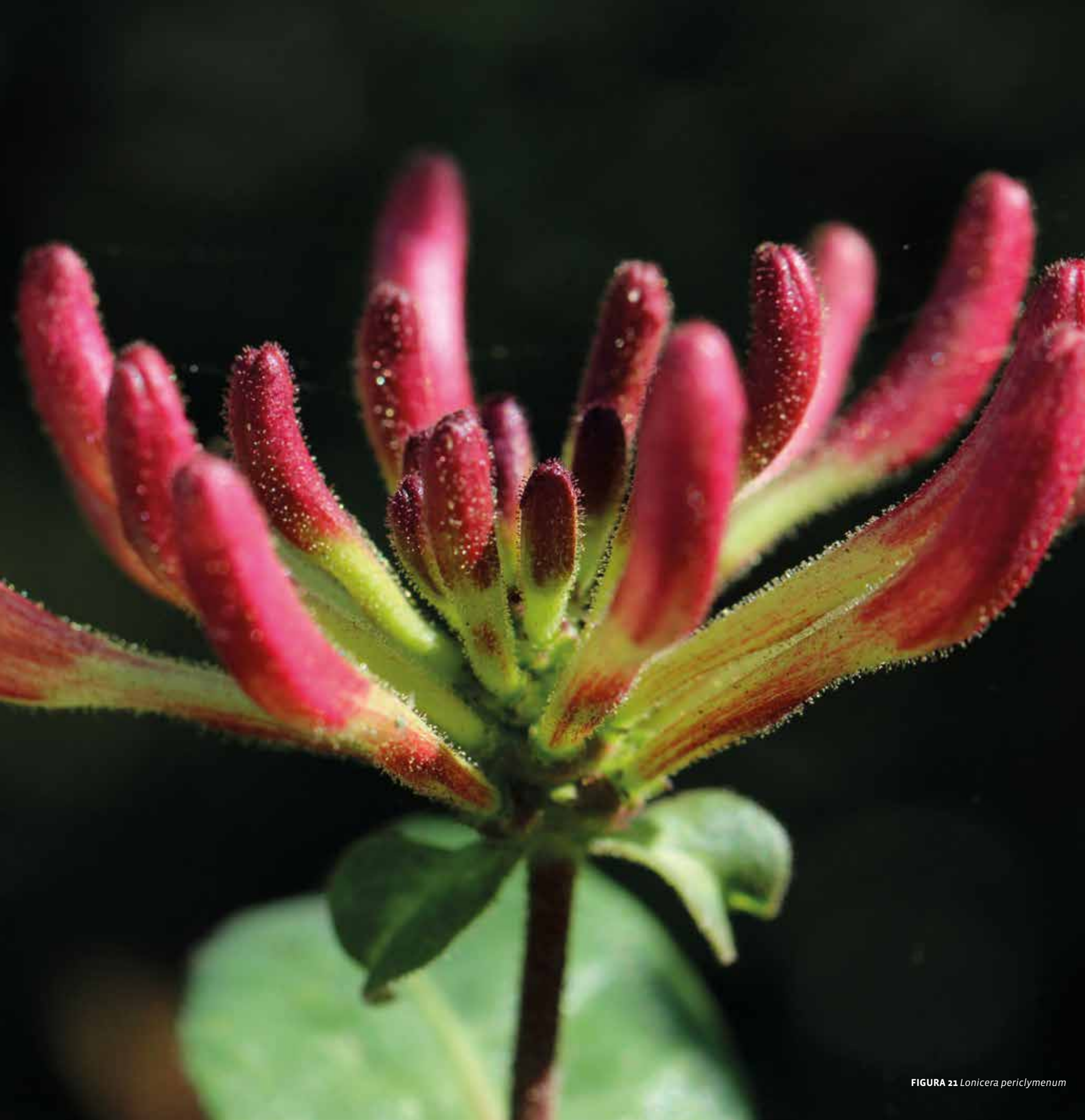
FIGURA 21 Lonicera periclymenum

sidade, a espessura e o tipo de folhagem dominante destes estratos influenciam a densidade do subcoberto ao nível herbáceo e de trepadeiras, que nos carvalhais é caracterizada pela ocorrência de geófitos de floração precoce, como o narciso ( Narcissus triandrus ), dente-de-cão ( Erythronium dens-canis ), anêmona-dos-bosques ( Anemone trifolia ), por espécies trepadeiras, como a hera ( Hedera spp.), a uva-de-cão ( Tamus communis ), a madressilva ( Lonicera periclymenum subsp. periclymenum ), acompanhados por diversas espécies de musgos e fetos, onde se destacam os Polypodium spp., Dryopteris spp. e Asplenium spp.