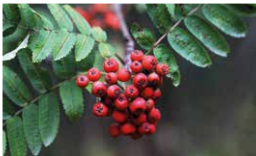
FIGURA 30 Sorbus aucuparia