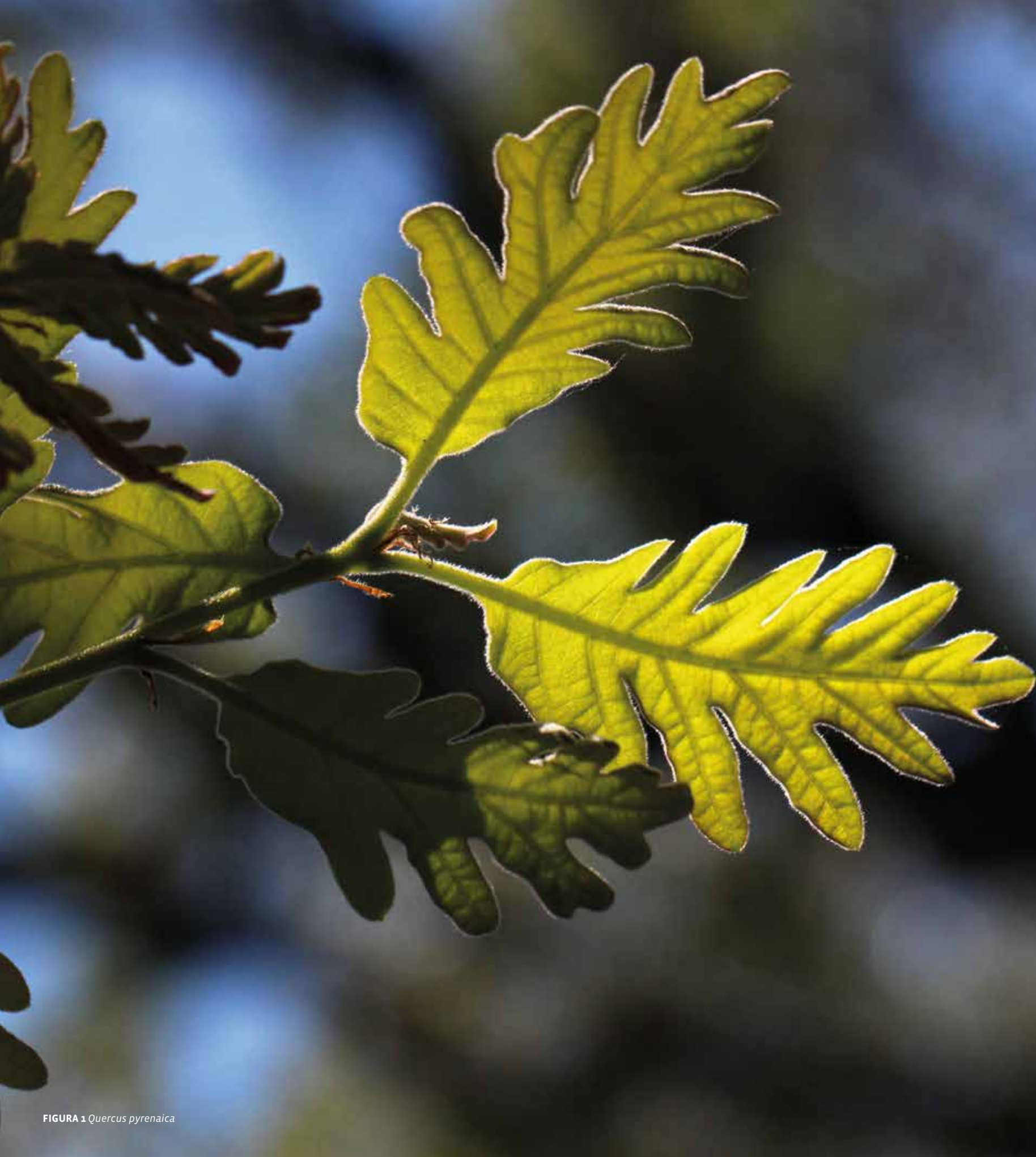
FIGURA 1 Quercus pyrenaica