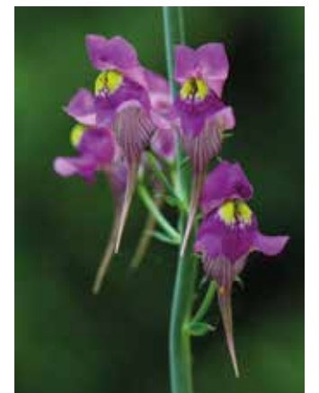
FIGURA 28 Linaria triornithophora

Atualmente estas florestas naturais encontram-se reduzidas, constituindo pequenos bosques frequentemente situados nas encostas declivosas de zonas montanhosas. A fragmentação da Fagosilva deve-se sobretudo à plantação de monoculturas (pinheiro e eucalipto), aos incêndios recorrentes e à proliferação de espécies exóticas invasoras. Tentar inverter estes processos e salvar a Fagosilva é urgente e prioritário. O que fizermos no presente terá consequências para a vitalidade e resiliência da floresta portuguesa no futuro, a médio e longo prazo.