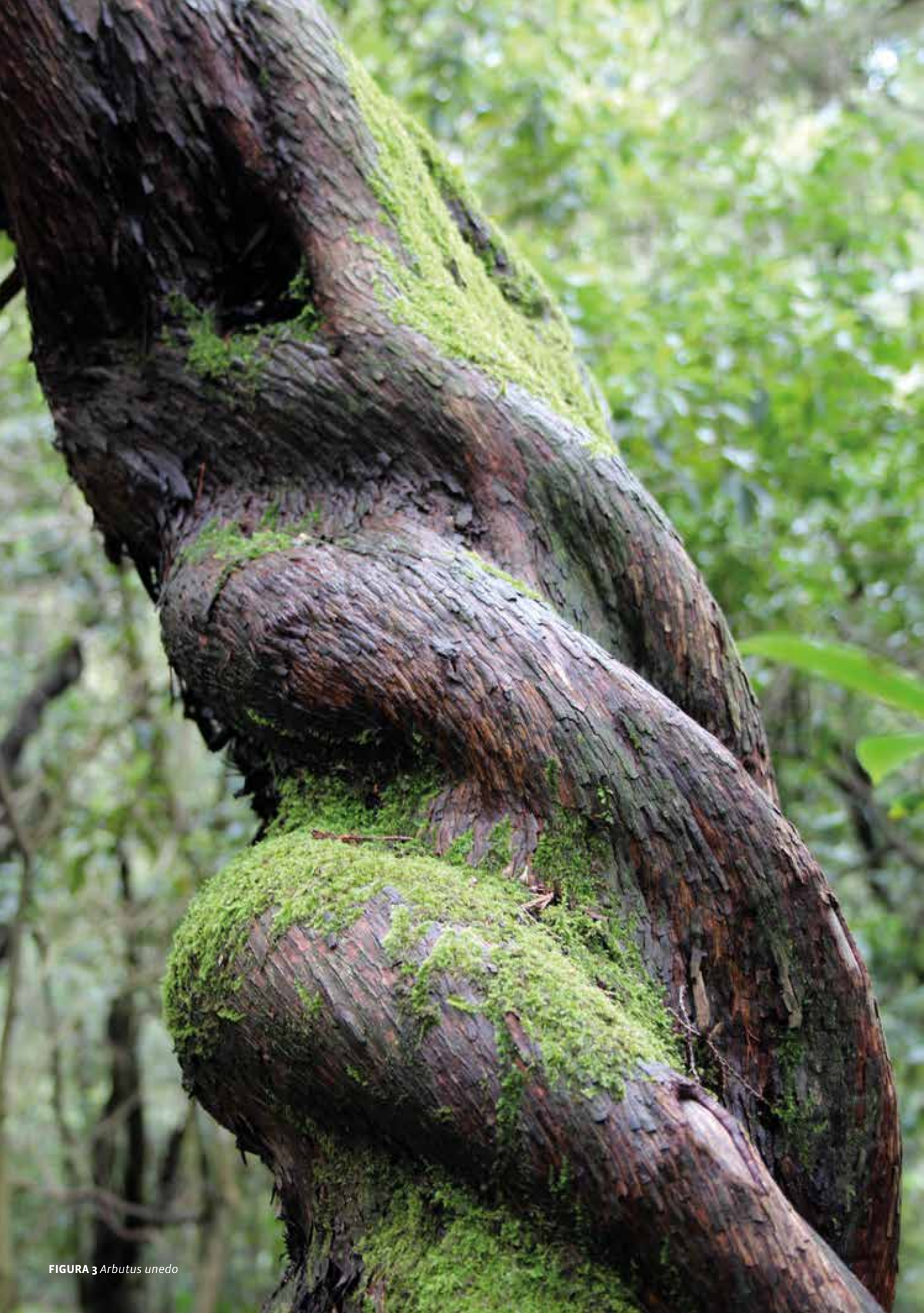
FIGURA 3 Arbutus unedo