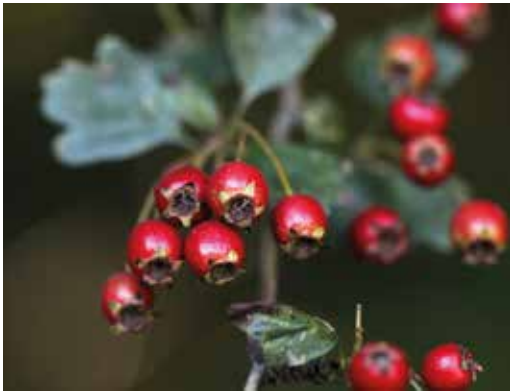
FIGURA 9 Crataegus monogyna