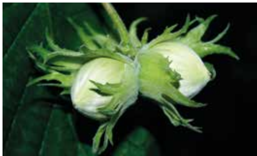
FIGURA 31 Corylus avellana