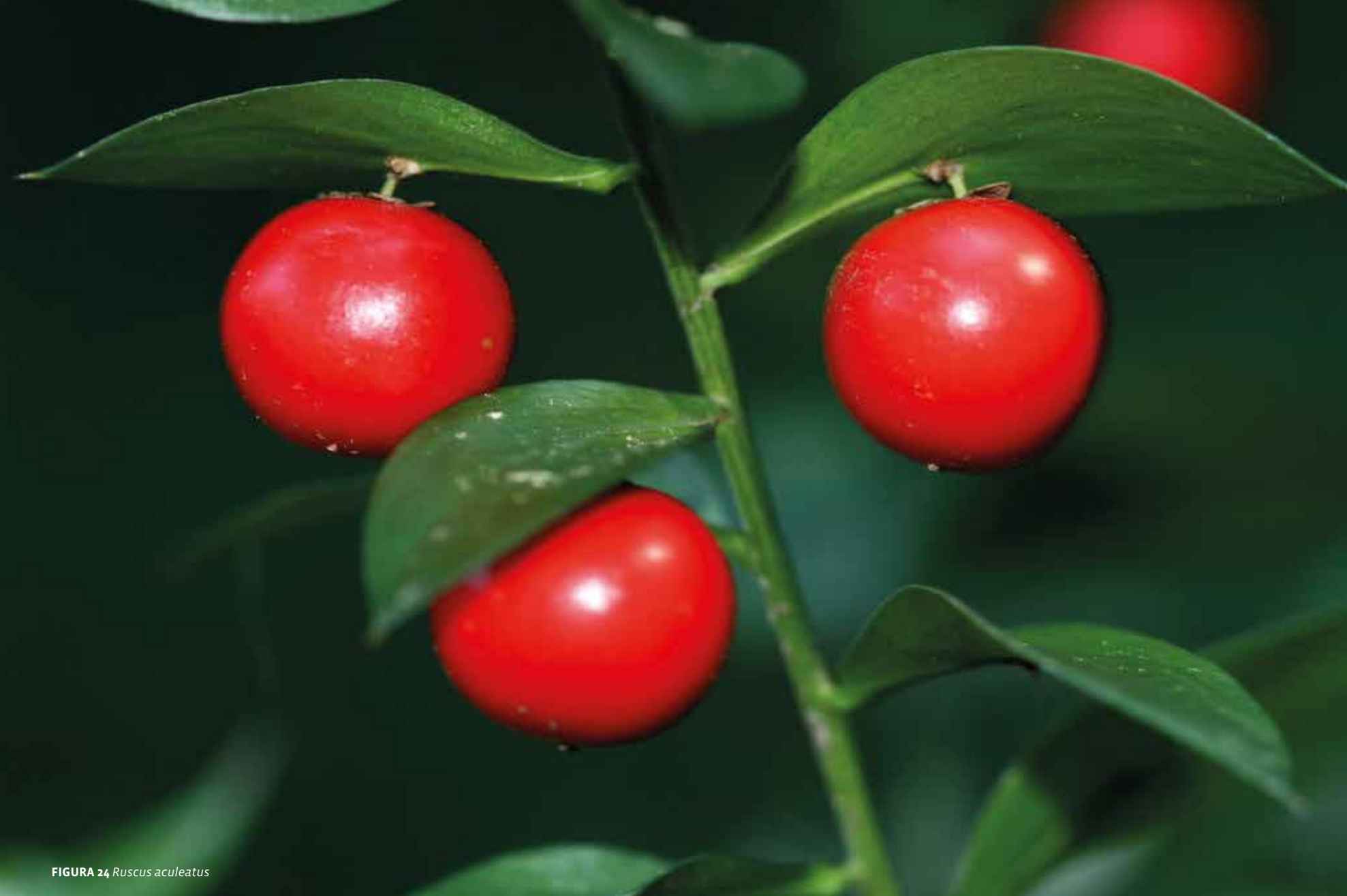
FIGURA 24 Ruscus aculeatus