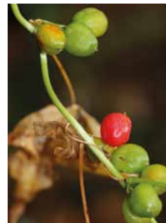
FIGURA 27 Tamus communis