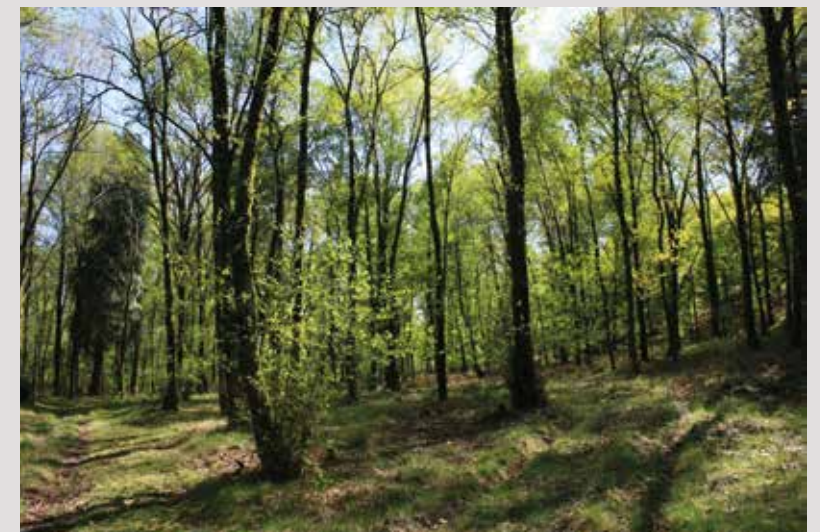
FIGURA 2 Carvalhal

Herbário do Departamento de Biologia da Universidade de Aveiro