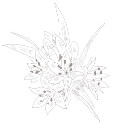
FIGURA 22 Erythronium dens-canis .

sidade, a espessura e o tipo de folhagem dominante destes estratos influenciam a densidade do subcoberto ao nível herbáceo e de trepadeiras, que nos carvalhais é caracterizada pela ocorrência de geófitos de floração precoce, como o narciso ( Narcissus triandrus ), dente-de-cão ( Erythronium dens-canis ), anêmona-dos-bosques ( Anemone trifolia ), por espécies trepadeiras, como a hera ( Hedera spp.), a uva-de-cão ( Tamus communis ), a madressilva ( Lonicera periclymenum subsp. periclymenum ), acompanhados por diversas espécies de musgos e fetos, onde se destacam os Polypodium spp., Dryopteris spp. e Asplenium spp.