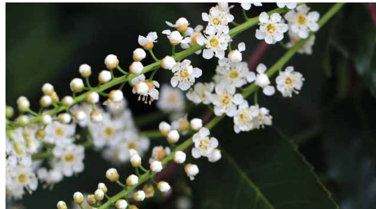
FIGURA 6 Prunus lusitanica

Antes da última glaciação (Würm), que começou há 100 mil anos e terminou há 12 mil, o território continental de Portugal possuía um clima subtropical húmido e a floresta que existia era constituída por árvores de folhas persistentes, com uma composição semelhante à que podemos observar ainda hoje na região biogeográfica Macaronésica (Madeira, Açores, Canárias e Cabo Verde). Essa floresta, denominada Laurissilva, devido ao facto de dominarem espécies lenhosas da família Lauraceae, como o louro ( Laurus nobilis ), não foi devastada nas ilhas pela glaciação, devido ao efeito amenizante do oceano Atlântico, uma vez que a água é um termorregulador. Assim as temperaturas não atingiram valores tão baixos como no continente, onde a Laurissilva foi profundamente afetada e quase extinta.