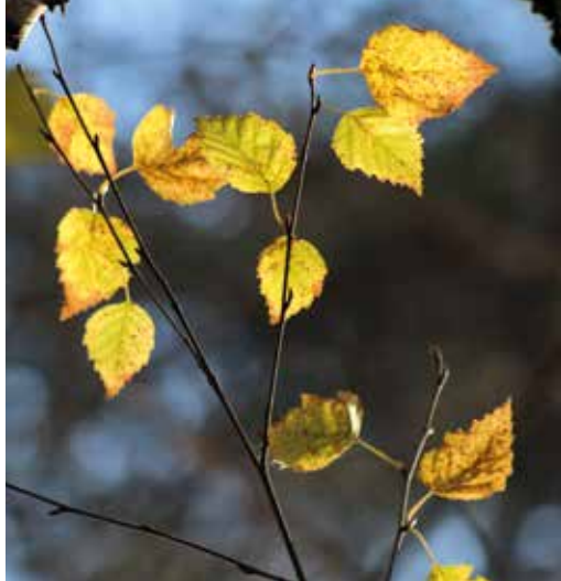
FIGURA 13 Betula pubescens