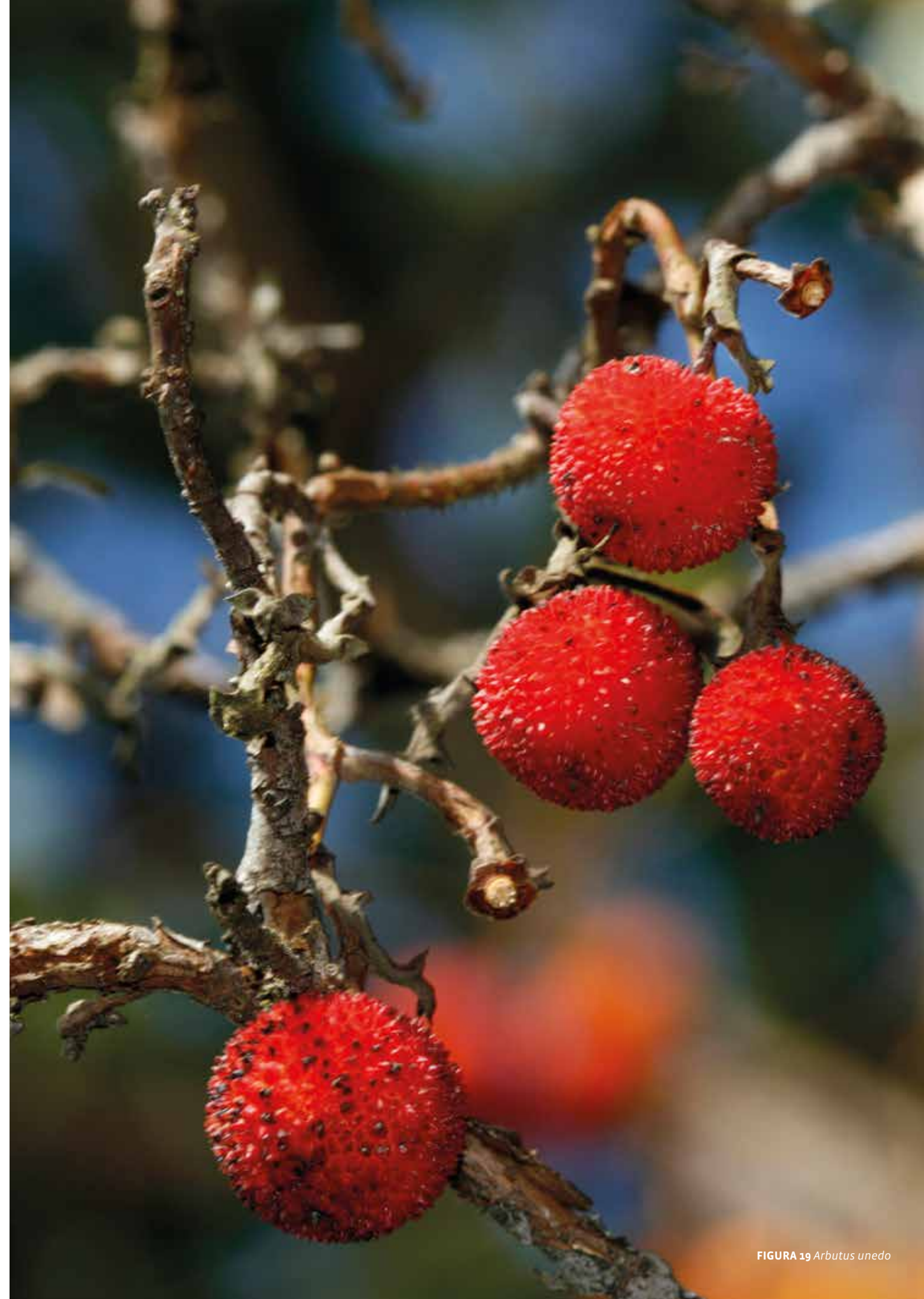
FIGURA 19 Arbutus unedo