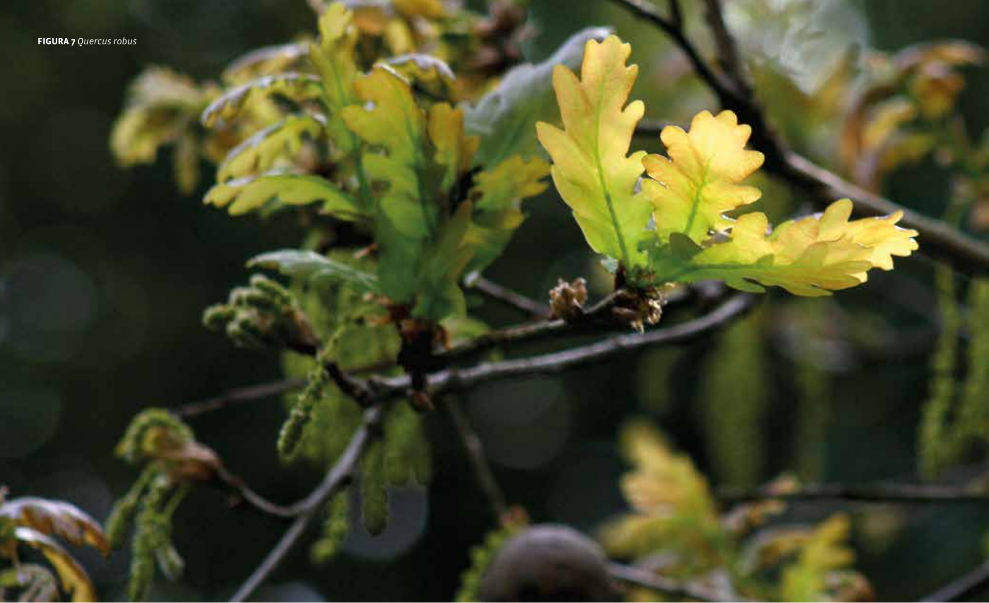
FIGURA 7 Quercus robur

A glaciação alterou o clima no território continental que passou a temperado mediterrânico. O clima mediterrânico é o único onde a estação fria está associada à estação das chuvas e o verão corresponde à estação seca. Essas alterações fizeram com que o nicho ecológico da Laurissilva fosse ocupado por uma nova floresta, com espécies mais adaptadas às condições pós-glaciares. Surgiu desta forma uma nova floresta climácica, em que as espécies lenhosas dominantes pertenciam à família Fagaceae, como os carvalhos (género Quercus ), a faia ( Fagus sylvatica ), com distribuição natural apenas no norte da Galiza, e o castanheiro ( Castanea sativa ). E em consonância com a Laurissilva, esta floresta foi designada de FAGOSILVA ( silva que significa selva, floresta ou bosque e fago referente à família Fagaceae).