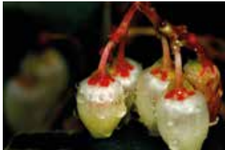
FIGURA 11 Arbutus unedo