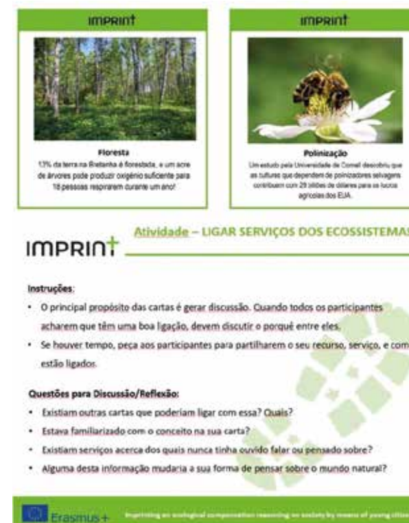
FIGURA 3 Exemplo de materiais pedagógicos disponíveis no pacote de formação IMPRINT+ para professores e educadores.

O curso e o pacote formativo foram organizados em sete módulos de formação, cada um com um tema e objetivos claros. Alguns módulos são eminentemente teóricos, porém outros são práticos ou teórico-práticos, o que se revelou fundamental para cativar os participantes/formandos e motivá-los para as questões do ambiente e sustentabilidade, independentemente da área de formação de cada um. Para cada módulo estão disponíveis os diapositivos e materiais a usar nas sessões teóricas, mas também todas as notas e materiais necessários para dinamizar as atividades de grupo ou em campo (figura 3), incluindo instruções sobre ‘como lecionar este módulo’ . Todo o pacote formativo está disponível nas várias línguas dos parceiros: Português, Inglês, Espanhol, Alemão, Italiano e Francês.