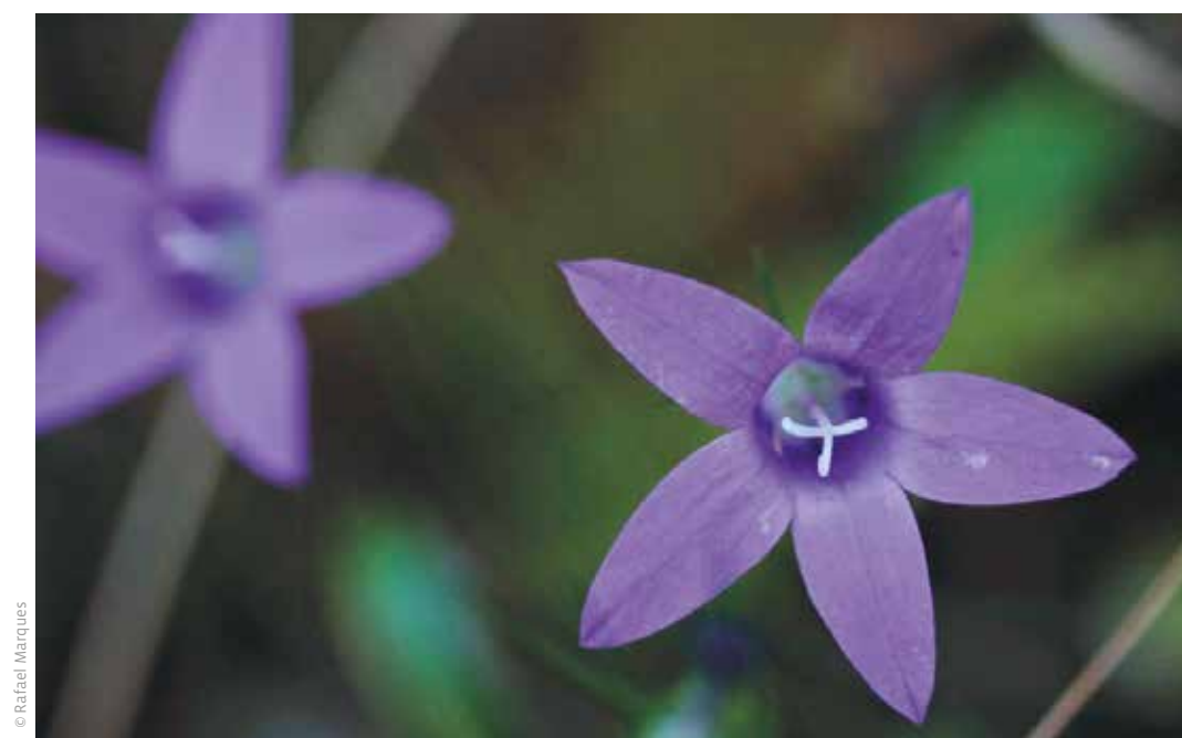
FIGURA 5B Amostragem de fauna e flora realizada durante o Programa Piloto.