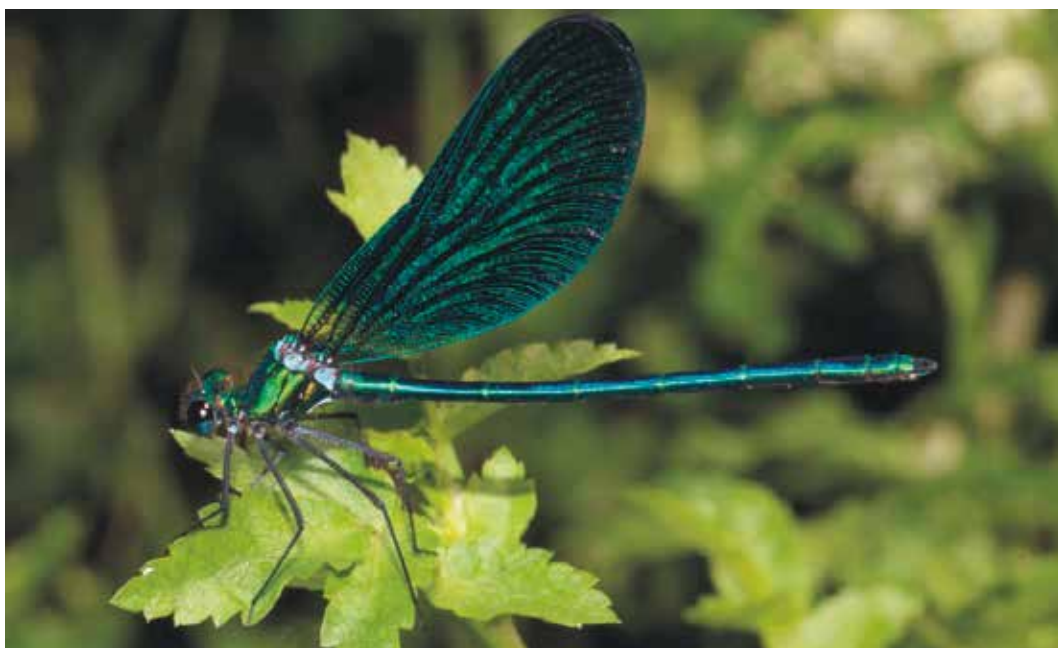
FIGURA 5C Amostragem de fauna e flora realizada durante o Programa Piloto.

como prioritárias, “ Lousada Charcos ”, que visa a criação de charcos para a vida selvagem em locais identificados para o efeito e “ BioLousada ”, programa regular de educação e sensibilização ambiental. Também no âmbito do programa piloto são regularmente organizadas caminhadas ambientais, com o fim de promover o contacto com a natureza e as boas práticas ambientais, tal como a recolha de lixo dos espaços pú-