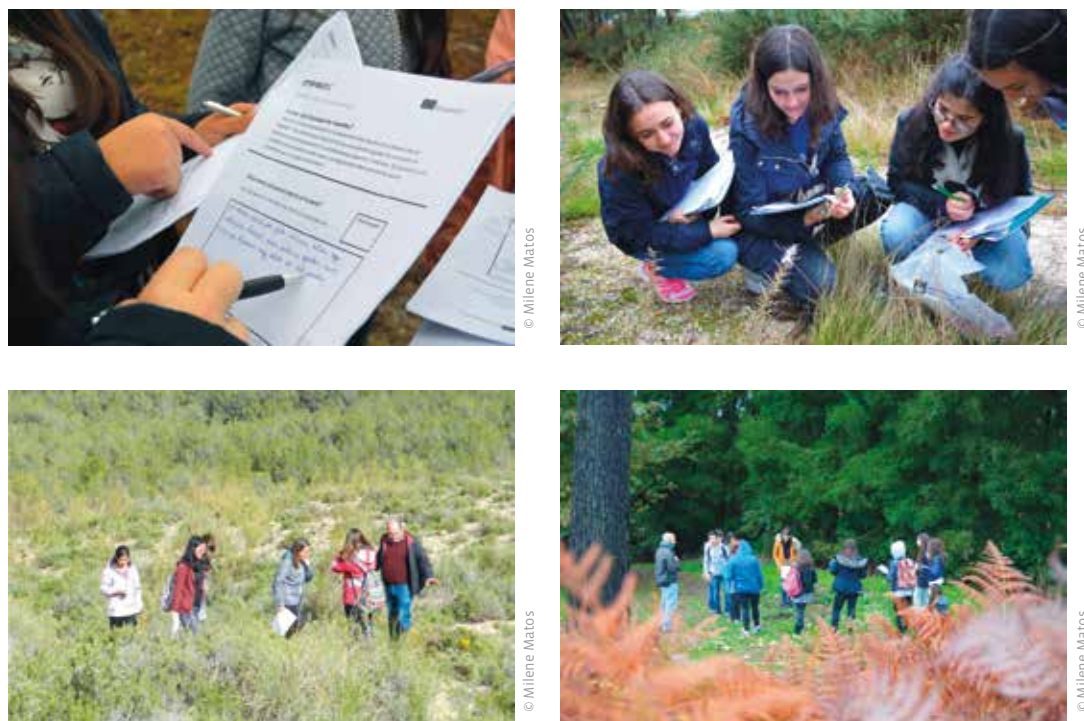
FIGURA 4 Utilização do tutorial para avaliação do estado ecológico das áreas de estudo, em Portugal e Espanha.

Este produto intelectual consiste num tutorial desenvolvido para todos os interessados em participar nas ações de compensação de pegada ecológica sugeridas pelo IMPRINT+ . Permite diagnosticar corretamente a situação ambiental dos territórios/terrenos/áreas de intervenção que constituem o seu campo de ação local. Perante os resultados obtidos serão capazes de identificar locais prioritários de intervenção e implementar medidas de compensação/restauro ambiental. Este tutorial fornece informações ecológicas muito completas, mas numa linguagem muito acessível, tornando-se uma excelente ferramenta pedagógica e educativa para organizar saídas de campo com alunos, saídas técnicas com staff escolar ou de outras entidades, ou simplesmente atividades lúdicas em família (figura 4). O tutorial está disponível no website do Projeto ( https://imprintplus.org/documents/section/2 ) em duas versões: uma longa com todas as explicações necessárias para quem organiza a saída de campo (avaliação ecológica) e uma versão mais curta de trabalho para os estudantes/participantes ( worksheet ).