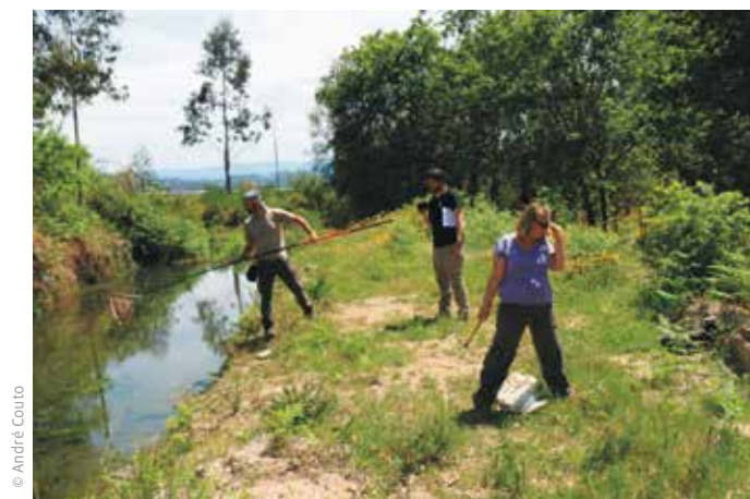
FIGURA 5A Amostragem de fauna e flora realizada durante o Programa Piloto.

O Projeto IMPRINT+ implementou um programa piloto que testou, à escala do município de Lousada, as metodologias de avaliação da qualidade ambiental do território, assim como analisou a exequibilidade das ações de compensação ecológica identificadas e mapeadas como prioritárias. Tal como previsto, os parceiros Portugueses (CML e UA) desenvolveram este programa piloto na íntegra, tendo-se procedido à caracterização ecológica completa do Município (figuras 5A, 5B, 5C e 5D). Com os resultados obtidos, nomeadamente no que respeita à priorização das necessidades de intervenção ecológica, instituíram-se os programas de envolvimento escolar e da comunidade “Plantar Lousada”, que visa a plantação de árvores autóctones nas áreas identificadas