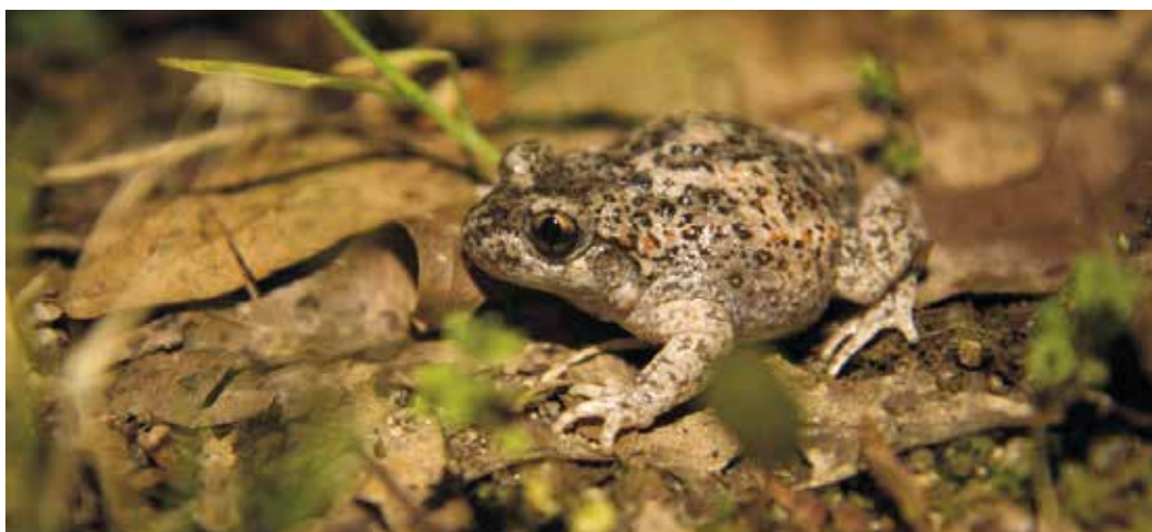
FIGURA 5D Amostragem de fauna e flora realizada durante o Programa Piloto.

A realização deste programa piloto foi decisiva para testar e avaliar todas as metodologias do Projeto, em condições conhecidas, para determinar ajustes que viriam a otimizar as metodologias de intervenção ambiental e social.