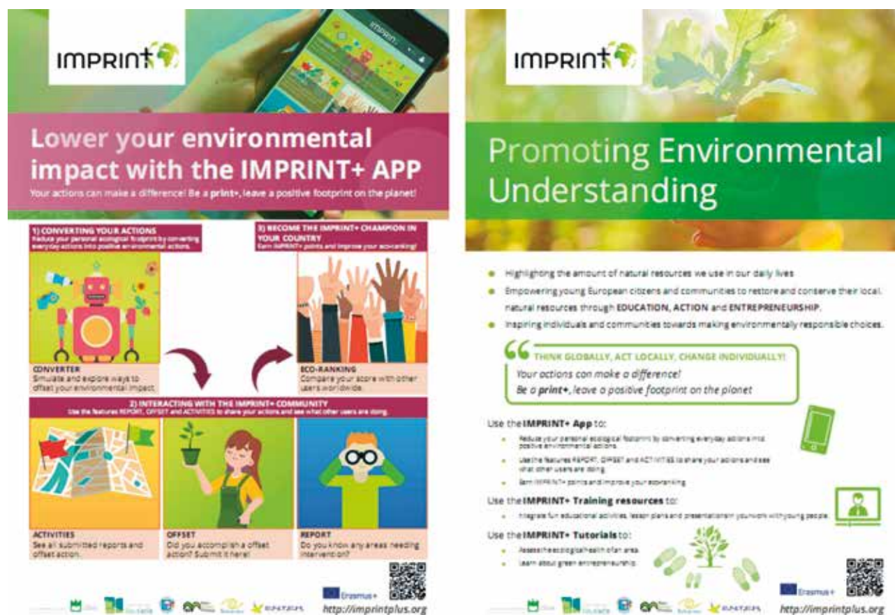
FIGURA 7 Pósteres informativos, um dos materiais de divulgação do Projeto, disponíveis na plataforma imprintplus.org .

No início do Projeto foi definido um plano de comunicação para o mesmo, após identificadas as estratégias de comunicação, os públicos-alvo, as mensagens-chave, os canais e as responsabilidades de cada parceiro. No plano de comunicação foram definidas as peças de comunicação que compõem o ‘ dissemination package ’, que deve ser entendido como um conjunto de materiais de divulgação que podem ser utilizados livremente por qualquer parceiro, mas também por qualquer pessoa ou entidade, exterior ao consórcio, que tenha interesse no IMPRINT+ ou que queira organizar eventos ou ações de formação relativas ao Projeto. Este ‘pacote de material informativo’ permite a maior e melhor disseminação do Projeto em termos simples e com mensagens trabalhadas para o público-alvo. O material está disponível para download no website do Projeto, através do endereço: https://imprintplus.org/documents/section/3 . Os materiais disponibilizados vão sendo constantemente atualizados à medida que novas ações são testadas e devidamente validadas (figura 7).