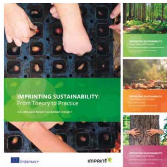
FIGURA 2 Capas do relatório inicial de Projeto, e respetivos capítulos temáticos.

Deste estudo resultou todo o enquadramento, em termos de investigação, que garantiu o grau de inovação e pertinência do Projeto. Mas tendo o Projeto como objetivo a simplicidade da comunicação e a sua inteligibilidade, o produto final naturalmente não se materializou numa extensa publicação científica. Antes, foi publicado em forma de manual, escrito em linguagem simples e apelativa, que explica os como e os porquês da sustentabilidade. O que é a pegada ecológica? Porque nos devemos preocupar com ela? Como podemos colaborar na mudança à escala individual? São algumas das perguntas abordadas na primeira parte. A segunda parte apresenta casos de estudo Europeus focados nas boas práticas e que representam exemplos inspiradores. O último capítulo, eminentemente prático, ensina como implementar ações de beneficiação ambiental concretas, desde plantar uma árvore a montar uma caixa-ninho para aves, construir um charco para a vida selvagem, ou remover espécies exóticas invasoras.