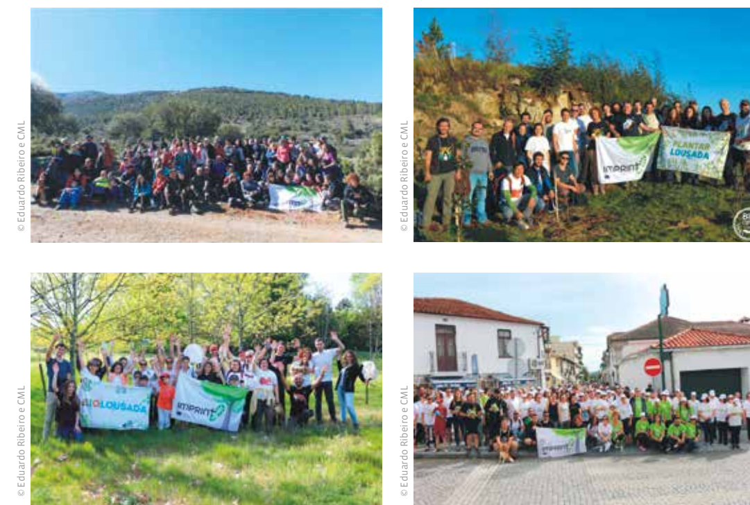
FIGURA 10 Programas de envolvimento social em ações ambientais IMPRINT+

O programa piloto permitiu caracterizar o património natural do município de Lousada e assim identificar os locais prioritários para intervenção ecológica. Foram identificadas 358 espécies de flora, 15 das quais com importante relevância conservacionista. Em termos de fauna, confirmou-se a presença de 151 espécies de vertebrados, correspondendo a 9 espécies de peixes, 11 anfíbios, 12 répteis, 86 aves e 33 mamíferos, nas quais se incluem várias espécies ameaçadas, endemismos ibéricos e fauna exótica.”